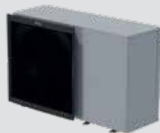
Unidad exterior: EBLA09-016D3V3