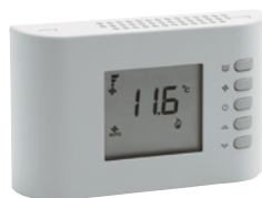
MANDO CR26 DC 0-10V NO INCLUIDO DE SERIE.