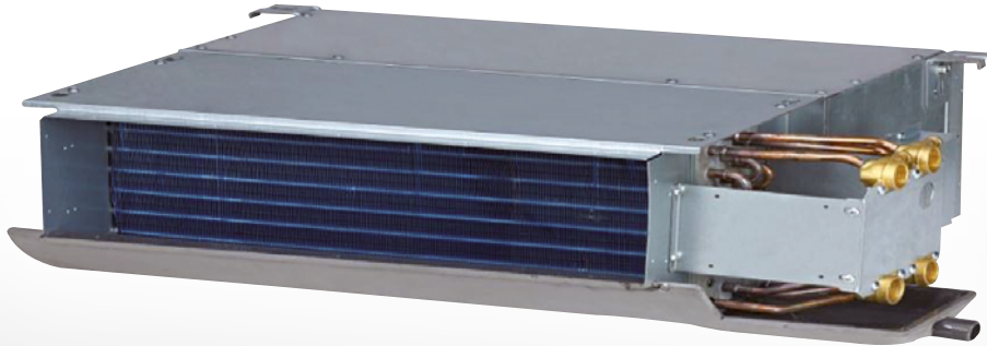
IMAGEN DE FANCOIL EN TOMA DE AGUA A DERECHAS