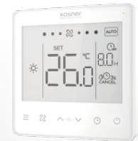
MANDO RECOMENDADO KJRP-86